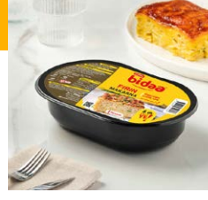
Fırın Makarna Mac & Cheese Soslu