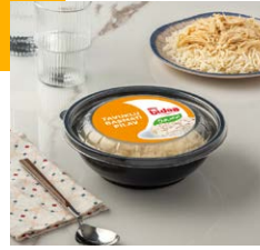
Tavuklu Basmati Pilav