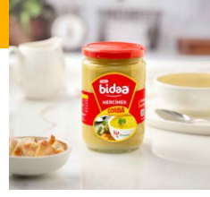
Mercimek Çorbası (Kavanoz)