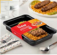
Adana Kebap +Bulgur Pilavı