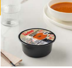
Domates Çorbası Kız Patlıcanlı