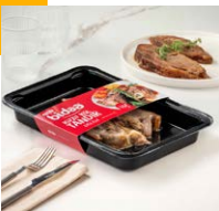
Kuzu Kol Tandır Dilimli