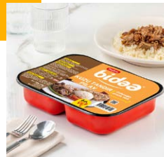
Pilav + Kuzu Tandır