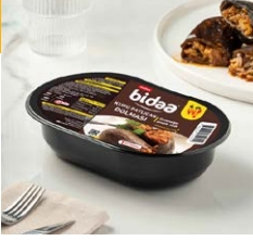
Kuru Patlıcan Dolma