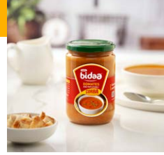
Domates Çorbası Kız Patlıcanlı (Kavanoz)