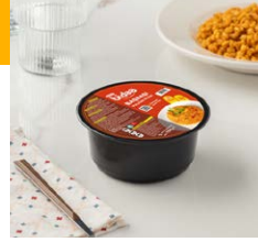
Bařbařı Bulgur Pilavı