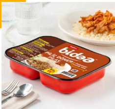
Pilav + Piliç Döner