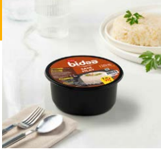
Tereyađlı Sade Pilav