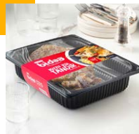
Kuzu Kol Tandır