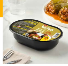
Kıymalı Biber Dolma