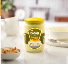
İlik Suyu Çorbası