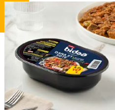
Dana Et Sote